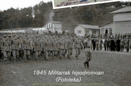
1945 Militarrek hipodromoan