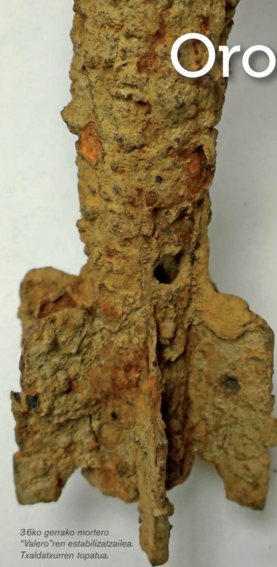
36ko gerrako mortero "Valero"ren estabilizatzailea. Txaldatxurren topatua.