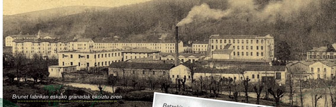
Brunet fabrikan eskuko granadak ekoiztu ziren