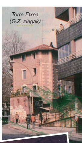
Torre Etxea (G.Z. ziegak)