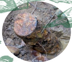
Artilleriako jaurtigai (75mm.)