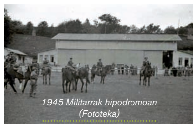
1945 Militarrek hipodromoan