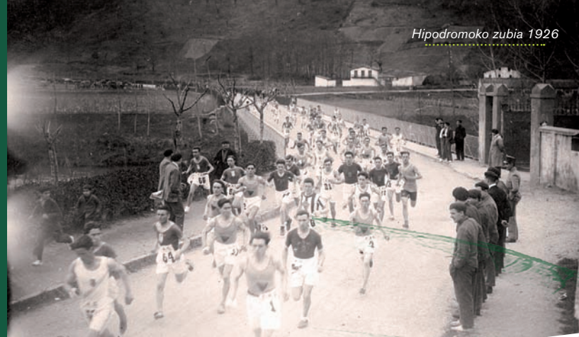
Hipodromoko zubia 1926

Nuestro agradecimiento a los testigos que estáis colaborando en la recuperación de nuestra memoria.